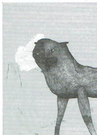
内田百合香 (1990- ) / Uchida, Yurika/big cat / 平成 23 年 /2011/ 個人蔵 / Private Collection